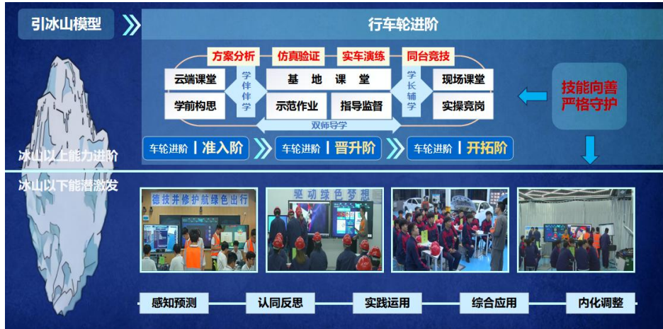
图 8-1 教学策略

教学方法主要包括讲授法、启发讨论教学法、情境教学法、实验教学法、案例教学法、研究教学法、现场教学法等，在教学中采用如下教学策略。教学策略，如图 8-1 所示。